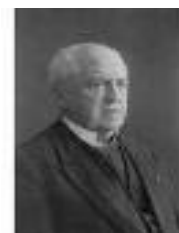
Dr. A. Kuiper

Met het oog op kerkherstel moet nu worden genoemd de naam van Dr. A. Kuiper. Om Dr. A. Kuiper schaarden zich al gauw de meer streng confessionelen. Zijn pogingen tot kerkherstel zijn uitgelopen in de bewuste doleantie Dr. Abraham Kuiper is in 1837 te Maassluis geboren en te Middelburg als knaap opgegroeid. Toen hij 18 jaar was, werd hij ingeschreven als student in de Letteren en Godgeleerdheid . Wel een bewijs, dat hij toen reeds bijzondere capaciteiten bezat.