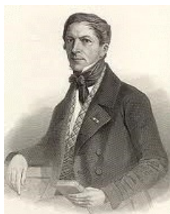
Groen v Prinsterer

In de Haagse gemeente trad hij met een grote brutaliteit op. Hij loochende op drieste wijze de waarheden der Heilige Schrift, en zijn wijze van prediken wekte bij het volk ontsteltenis.