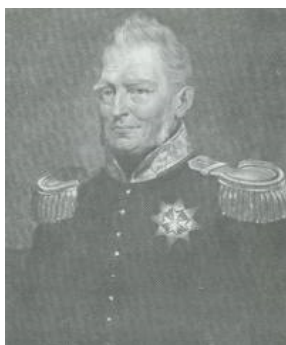
Koning Willem I

En volgens art. 139 der grondwet was de Raad van Staten van mening, dat de vorst zich wel met de financiën, doch niet met de inwendige aangelegenheden der kerken mocht bemoeien.