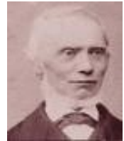
Ds v Velzen

Het strookte helemaal niet met de opvattingen die van Velzen later aan de dag legde. Het waren de betwiste punten tussen De Cock en Scholte, inzake Kerkgrip , Doopsbeschouwing en Belijdenis enz.